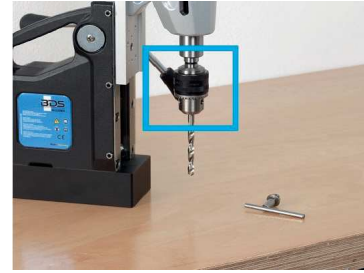
3. Spiral kesici uçlar kullanıma hazır.