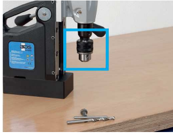
2. Mandreni doğrudan milin içine yerleştirin.