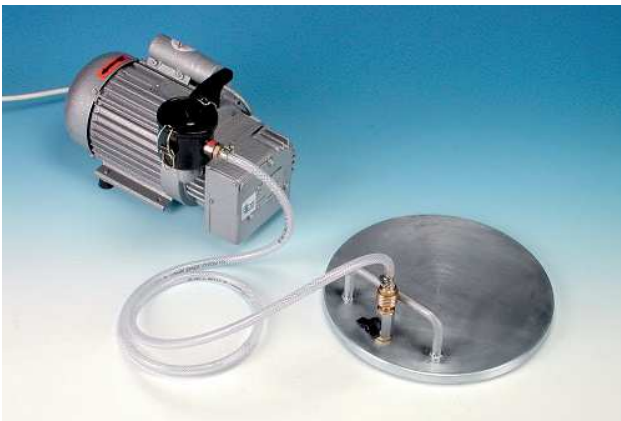
ZAV 300 - Vakumlu sıkıştırma cihazı