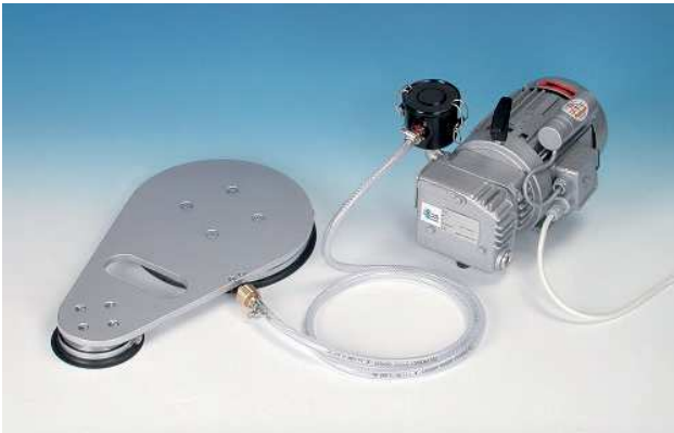
ZAV 400 - Vakumlu sıkıştırma cihazı